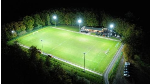
Sportplatz Nürtingen-Geislingen - neuem Flutlicht